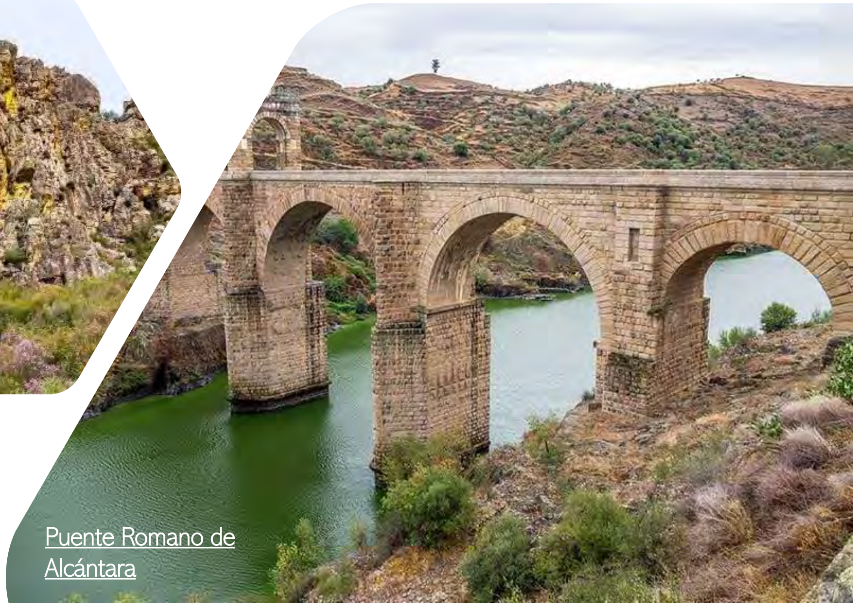
Puente Romano de Alcántara