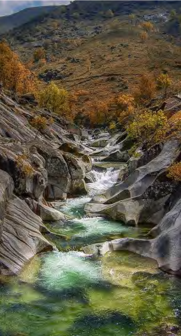
Valle del Jerte