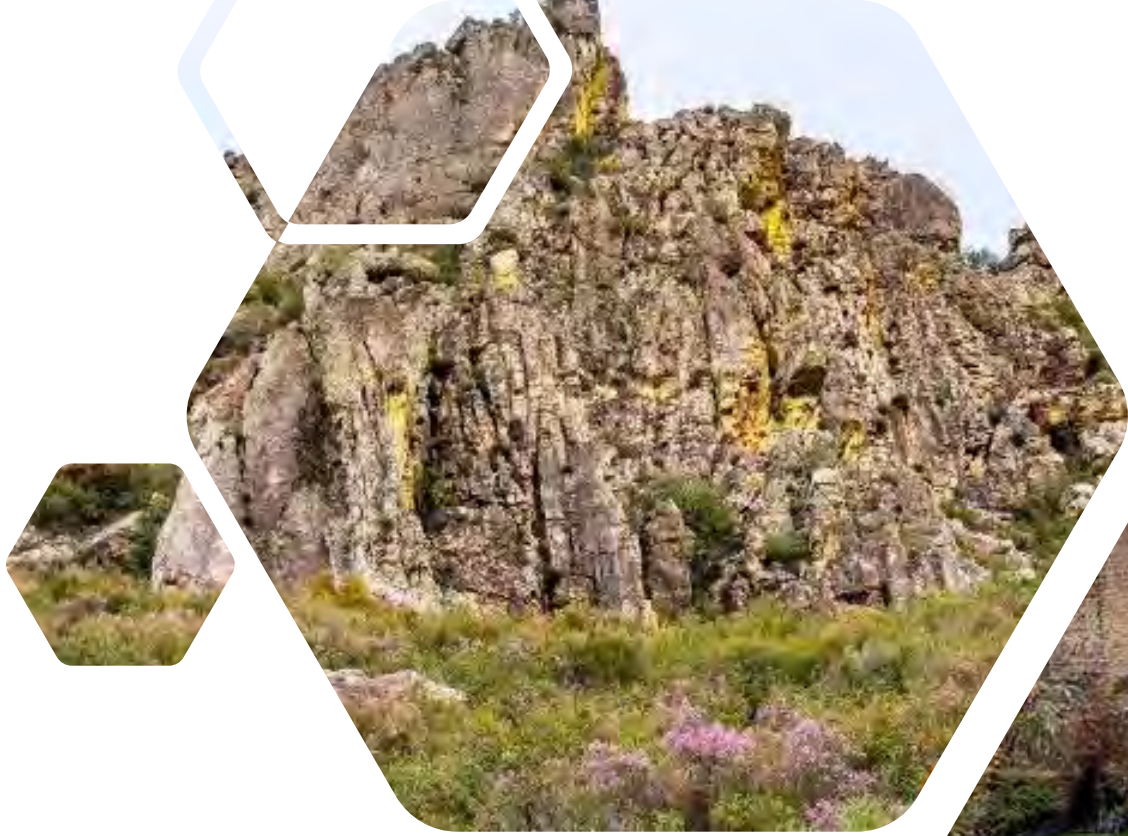
Geoparque Villuercas Ibores Jara